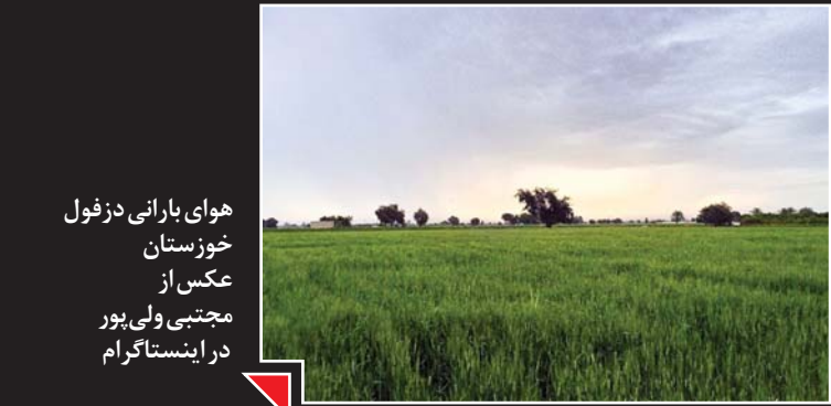
هوای بارانی دزفول خوزستان