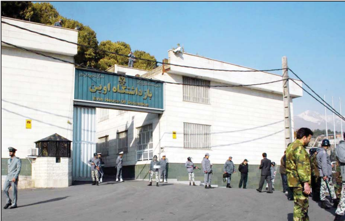
نماینده تهران دلیل مرگ جوان ۲۲ ساله در زندان را خودکشی اعلام کرد

توجه به سلامت روحی و روانی زندانیان نیز امری اجتناب ناپذیر است و نباید به هر دلیل از جمله کثرت بازداشتی ها به آن بی توجه بود. البته این امر که زندانی یا چه وسیله و به چه طریق دست به خودکشی زده است نیز جای اقدام دارد زیرا زمان بازداشت کلیه وسایلی و حتی لباس زندانی گرفته می شود و داشتن حتی بند کفش و کمربند نیز ممنوع است. حال اینکه یک فرد بدون دسترسی به لوازمی که ممکن است تسهیل کننده خودکشی باشد دست به چنین اقدامی زده، جای سوال دارد و مسئولان زندان اوین باید پاسخگوی عدم مراقبت از این فرد باشند.