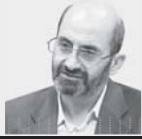
رسول جلیلی عضو شورای عالی فضای مجازی