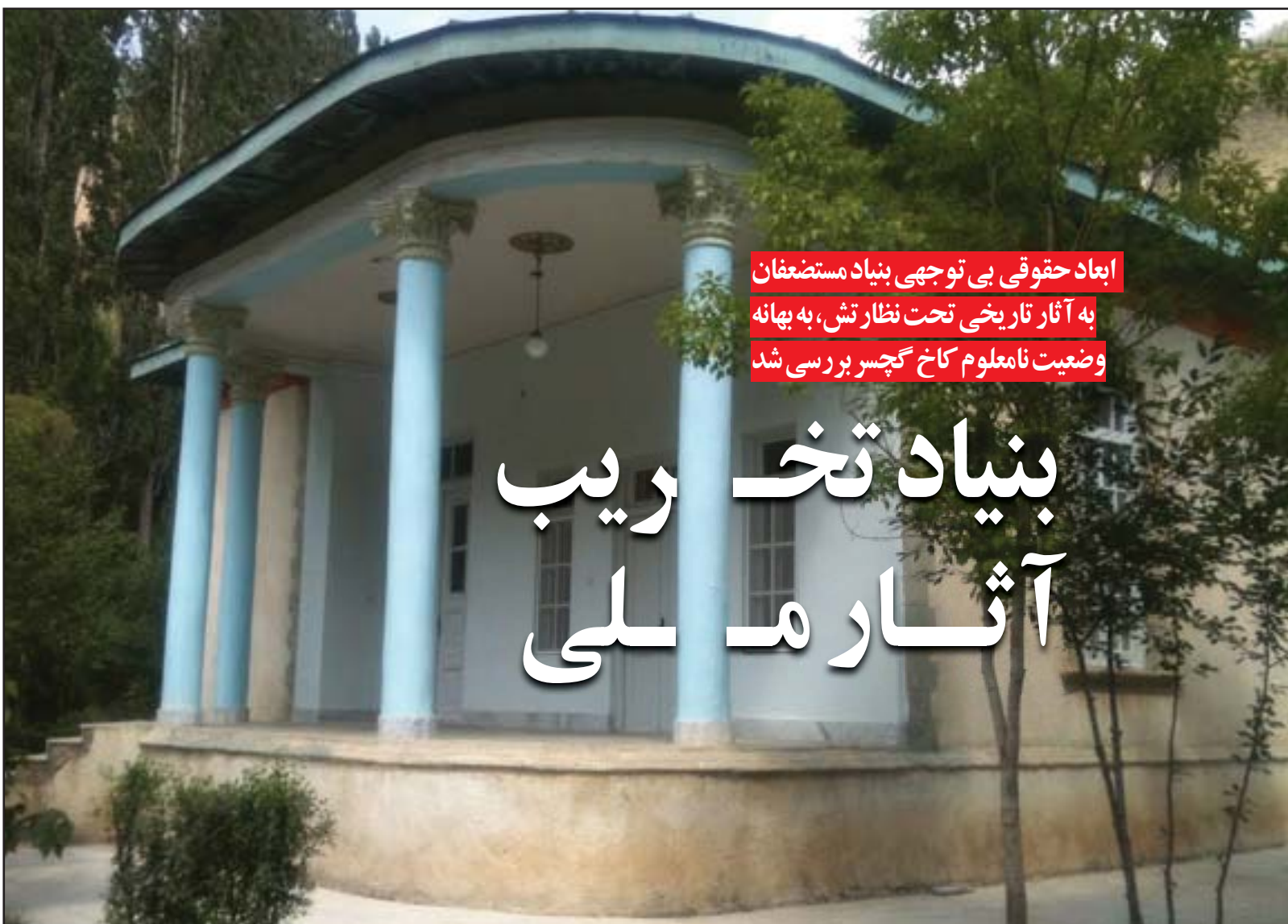
عکس مربوط به کاخ گچسور است